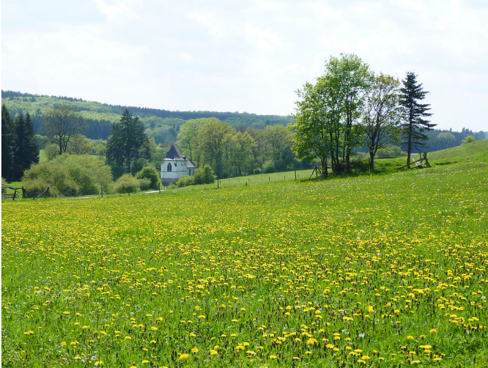
Nettersheim-Engelgau, Wallfahrtskirche St. Servatius, sogenannte Ahekapelle, einschl. Inventar