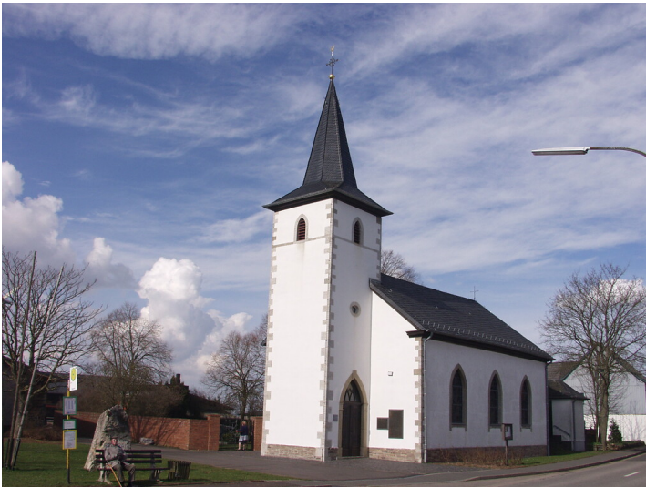
Antoniuskapelle in Roderath (2002)