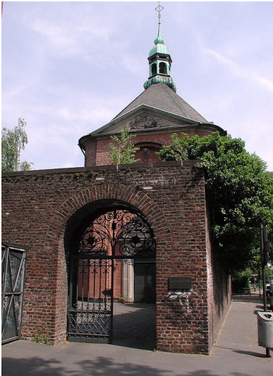
Katholische Privatkirche Sankt Gregorius im Elend