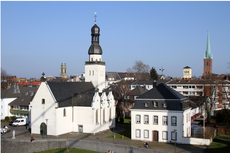
Clemenskirche in Köln Mülheim