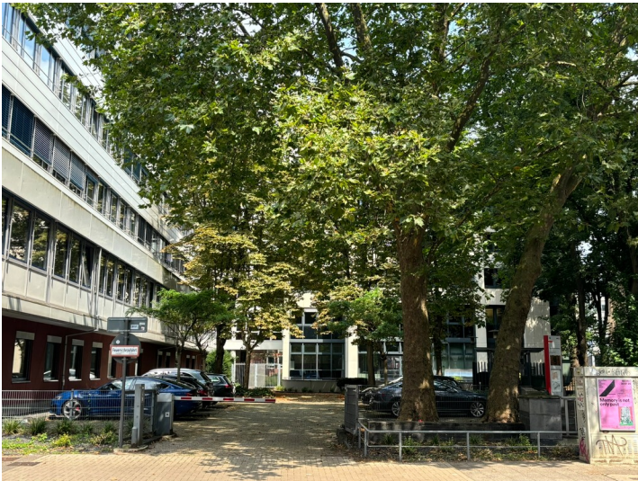
Parkplatz an der Stelle des ehemaligen Hospital Ipperwald an der Zeughausstraße (2024)