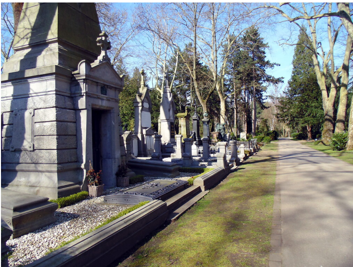
Ansicht des Feldes 60 a auf dem Melatenfriedhof in Köln-Lindenthal (2020)