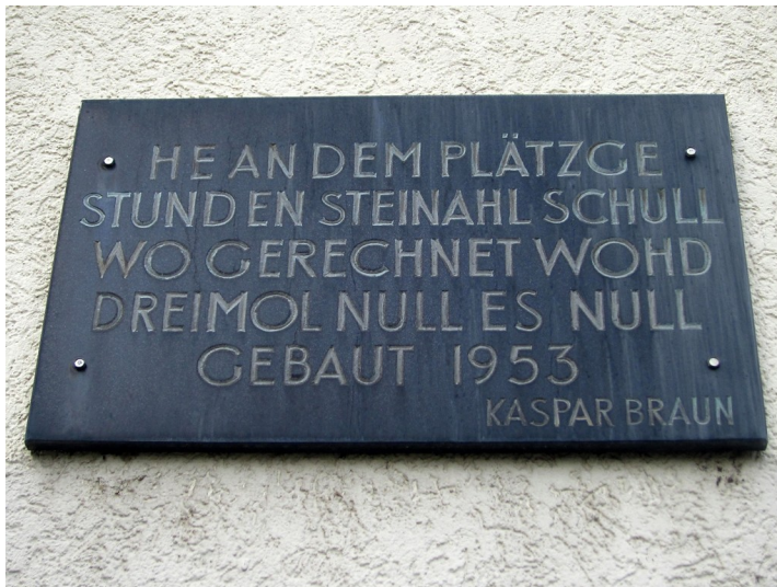
Inskriptentafel am Standort der früheren Schule Ecke Großer Griechenmarkt / Kaygasse ("Kayjass Nr. 0") in Köln (2012).