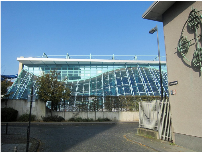
Das Kölner Hallenbad "Agrippabad" in der Kölner Kämmergasse 1 von der Färbergasse aus gesehen (2012).