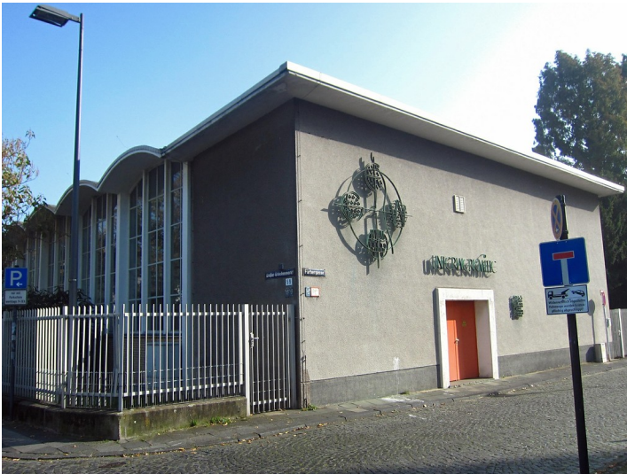
Das Umspannwerk "Unterwerk Mitte" am Großen Griechenmarkt 59 in Köln-Altstadt-Süd (2012).