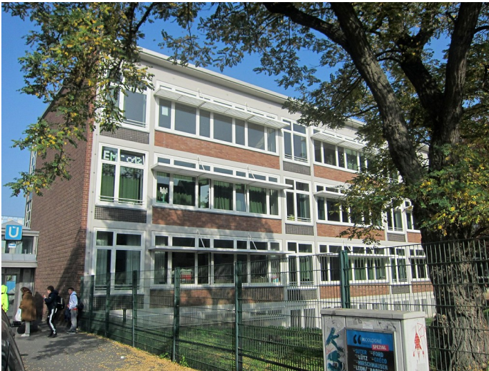
Das Hauptgebäude der Katholischen Hauptschule KHS am Griechenmarkt in Köln (2012).