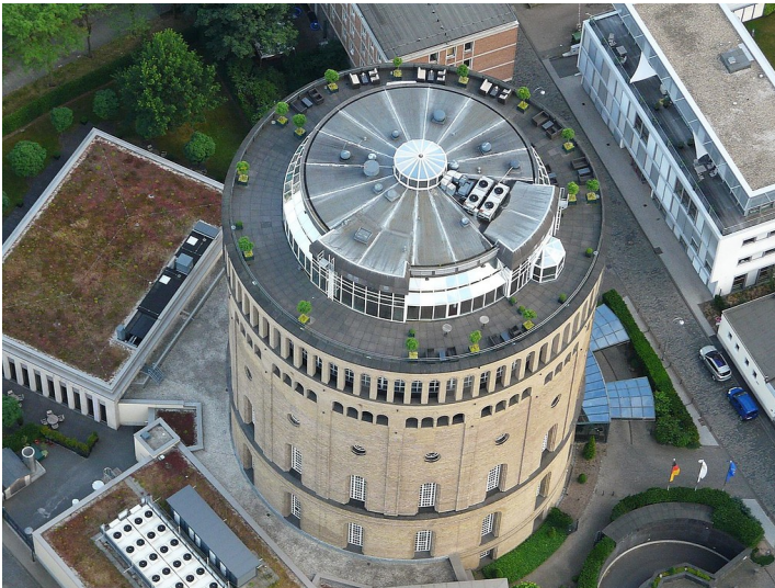
Luftaufnahme des Wasserturms an der Kölner Kaygasse (2010), heute Hotel im Wasserturm mit Restaurant Himmel un Äd.