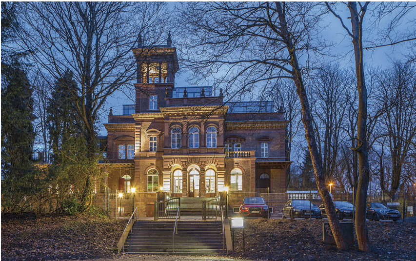
Kaiserbahnhof in Brühl-Kierberg (2018)