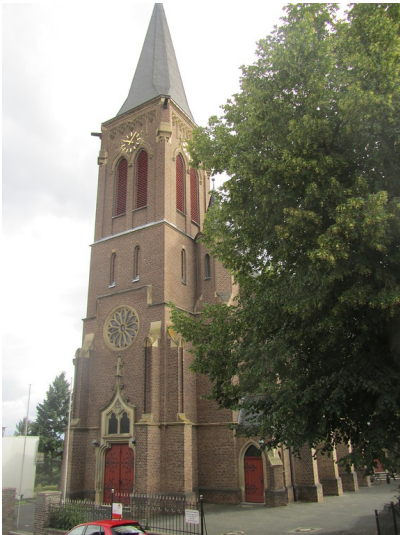
Katholische Kirche St. Pantaleon in Badorf (2014)