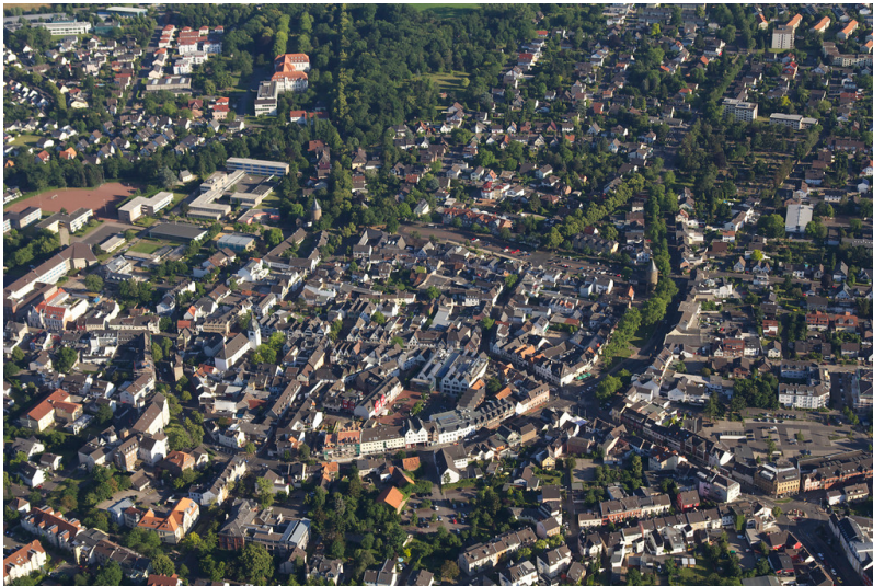
Spätmittelalterlicher Stadtkern von Rheinbach (2015)