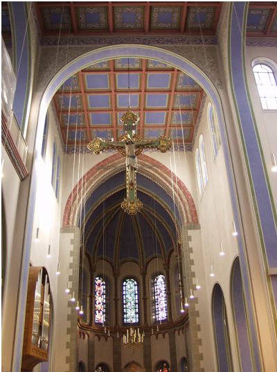
Pfarrkirche St.Jakob in Aachen