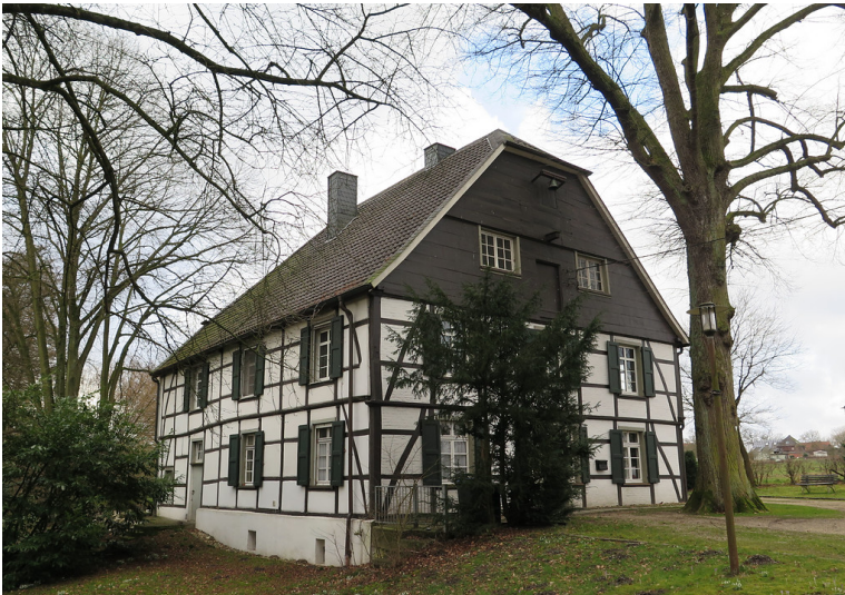
Das Fachwerkhaus des Gahlener Pastorats am Widemweg schräg von vorne (2014). Rechts im Bild ist die knapp 30 Meter hohe Winterlinde zu erkennen.