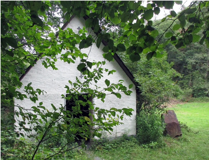
Die kleine Kapelle am früheren Standort des Zisterzienserinnenklosters Rosenthal im Pommerbachtal (2020).