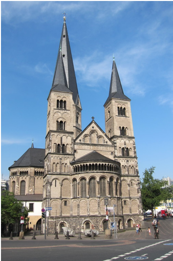
Ostfassade der Katholischen Pfarrkirche Sankt Cassius und Florentius in Bonn (2013)