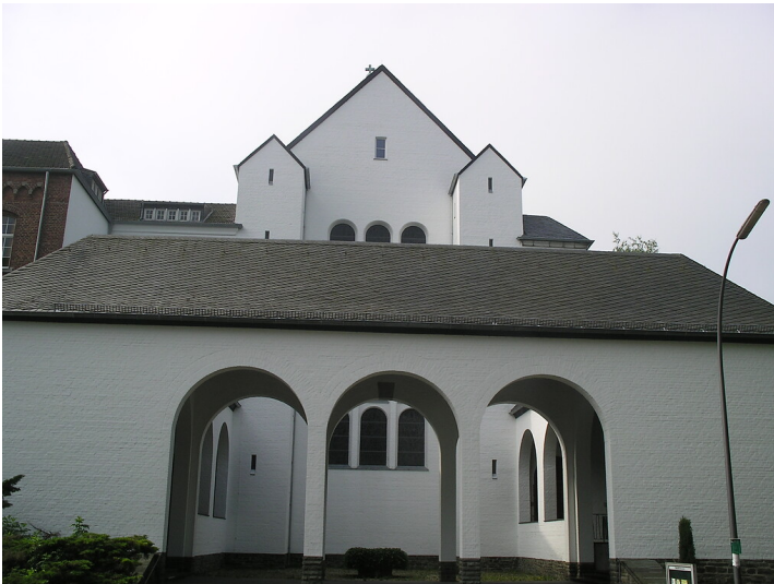
Benediktinerabteikirche in Aachen (2005)