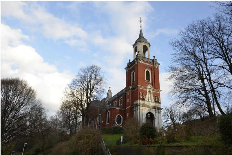
Katholische Pfarrkirche St. Michael in Aachen-Burtscheid (2015)