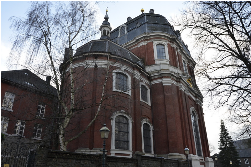
Nordseite der barocken Pfarrkirche St. Johann Baptist in Aachen-Burtscheid (2015)