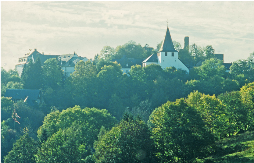
Dahlem-Kronenburg, Kath. Pfarrkirche St. Johann Baptist