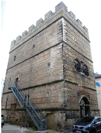
Mittelalterlicher Wohnturm "Frankenturm" in der Trierer Dietrichstraße (2013)