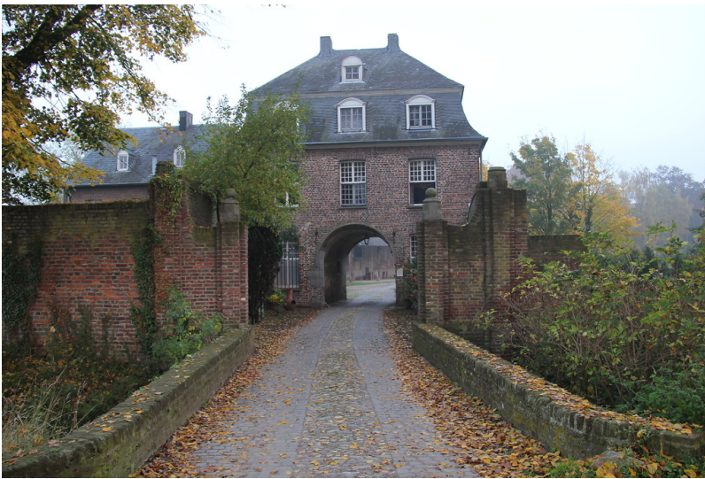
Torhaus des ehemaligen Klosters Graefenthal in Goch (2012)