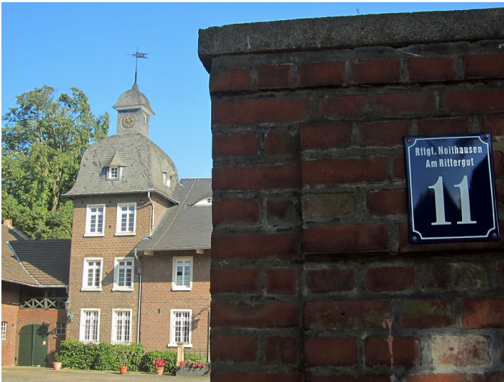
Blick in den Hof und das Hauptgebäude des früheren Ritterguts Noithausen (2014)