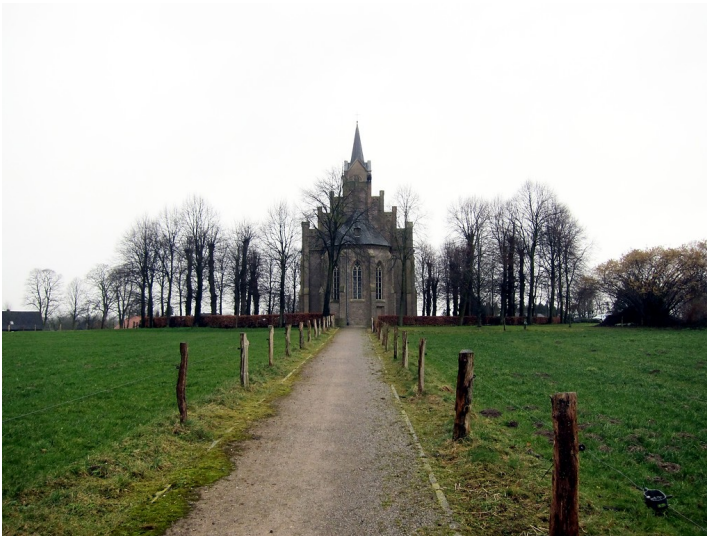
Die exponiert gelegene Elisabethkirche auf dem Louisenplatz in Louisendorf bei Bedburg-Hau, südöstliche Ansicht (2015).