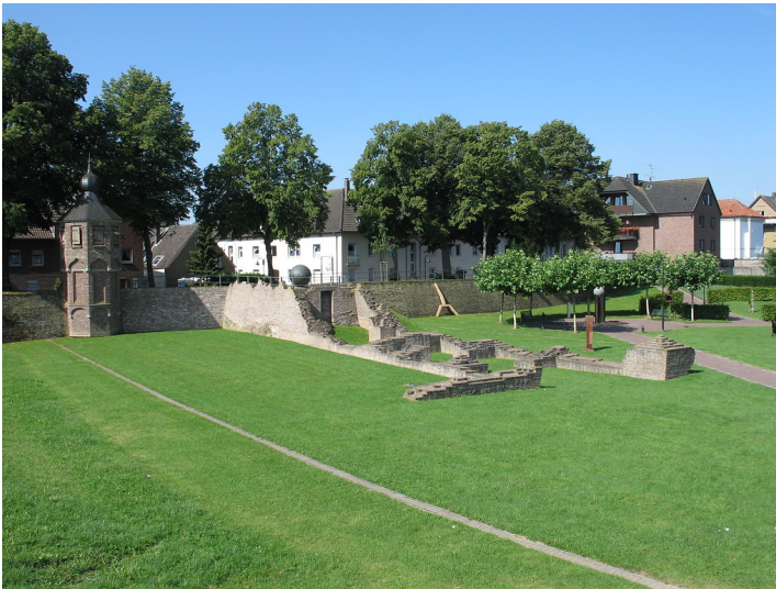
Stadtbefestigung Rees