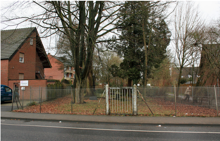
Der jüdische Friedhof Hardter Straße in Mönchengladbach-Rheindahlen (2015).