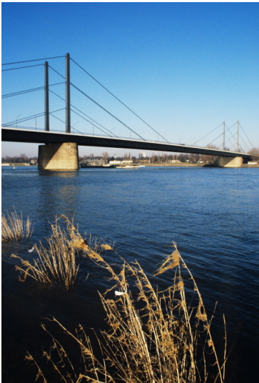
Rheinbrücke bei Rees, Kreis Kleve (2007)