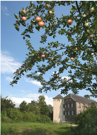
Obstwiese am Haus Bürgel