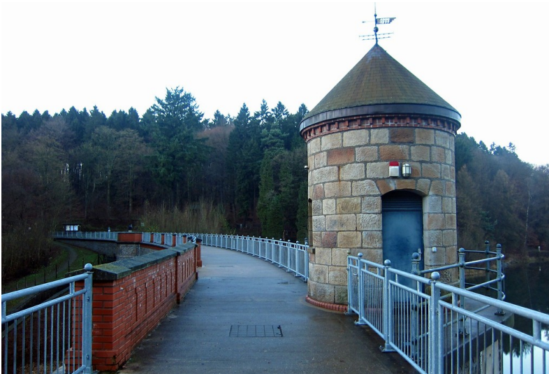
Blick über die Staumauer der Ronsdorfer Talsperre bei Wuppertal (2014).