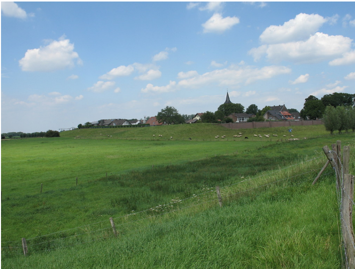
Deich bei Schenkenschanz