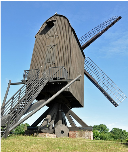
Rückwärtige Ansicht der "Tönisberger Mühle" in Kempen-Tönisberg (2017).