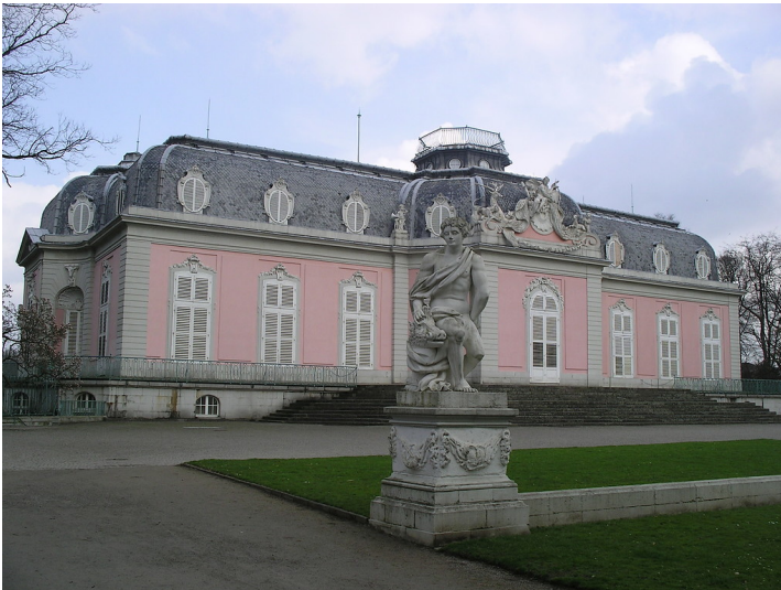
Schloss Benrath in Düsseldorf-Benrath