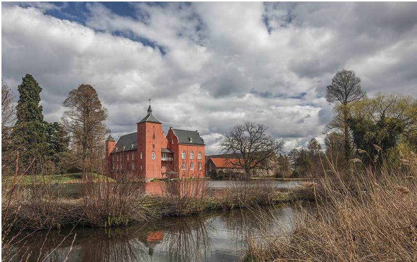
Schloss Bloemersheim bei Neukirchen-Vluyn (2018)