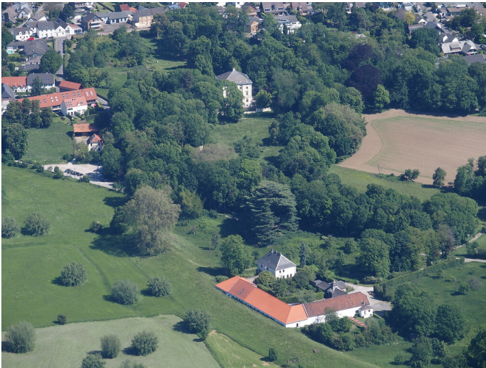
Schloss Meierhof, im Hintergrund Schloss Mickeln (2021)