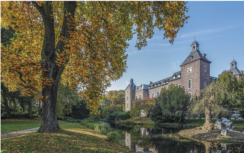
Schloss Neersen in Willich (2019)