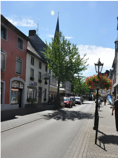
Blick über die Hochstraße im historischen Ortskern von Viersen-Süchteln (2017).