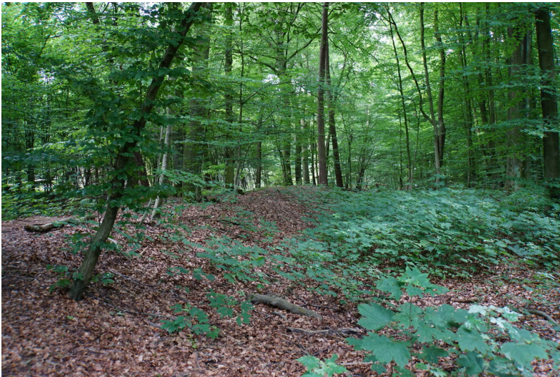
Landwehr Süchteln (2024)