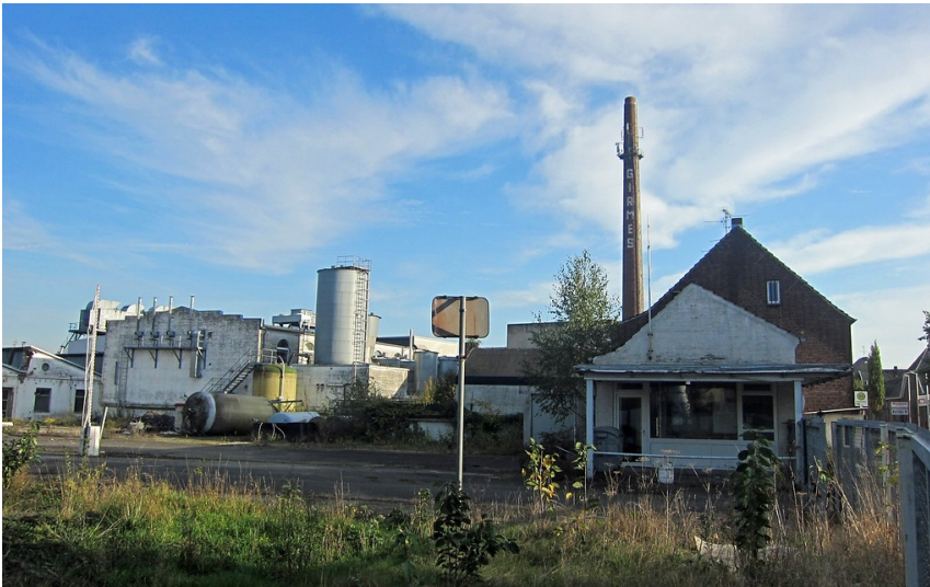
Gebäude und Einrichtungen auf dem Firmengelände der Girmes-Werke AG in Grefrath-Oedt (2013)