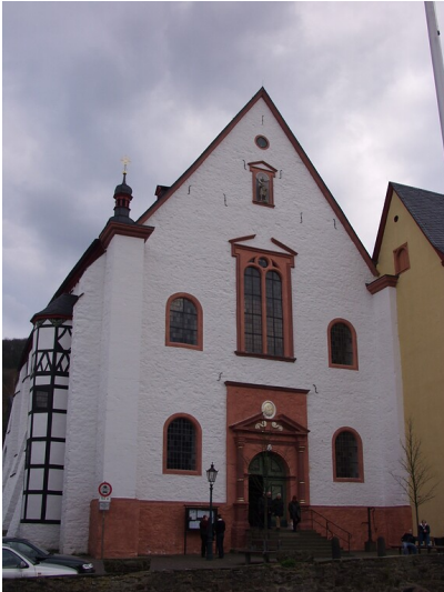
Katholische Filialkirche Sankt Donatus in Bad Münstereifel