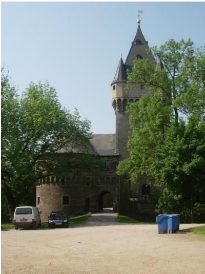
Burg Hülchrath