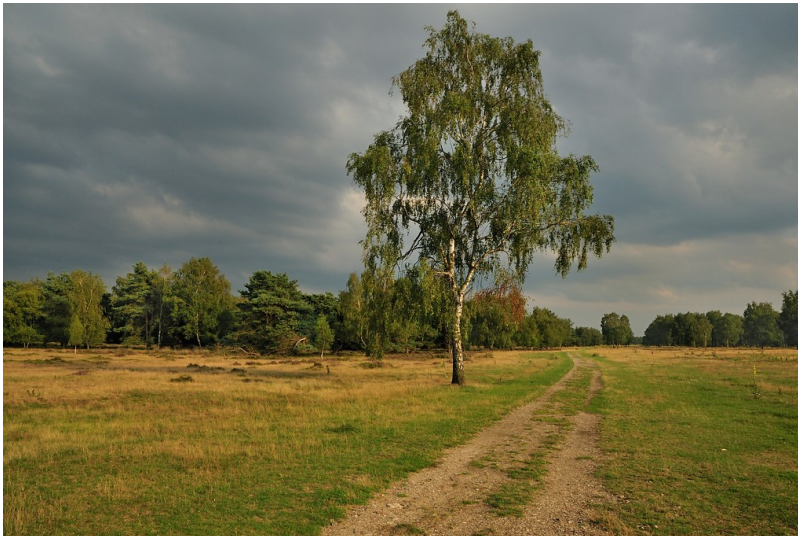
Birke am Weg in der Venloer Heide