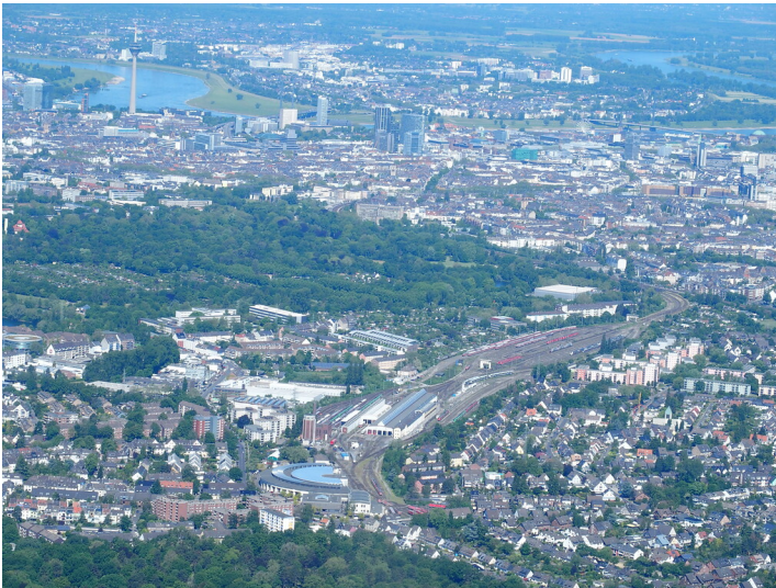
Düsseldorf Volksgarten (2021)