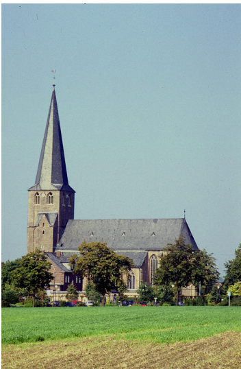
Kirche von Geldern-Walbeck, Kreis Kleve (2010)