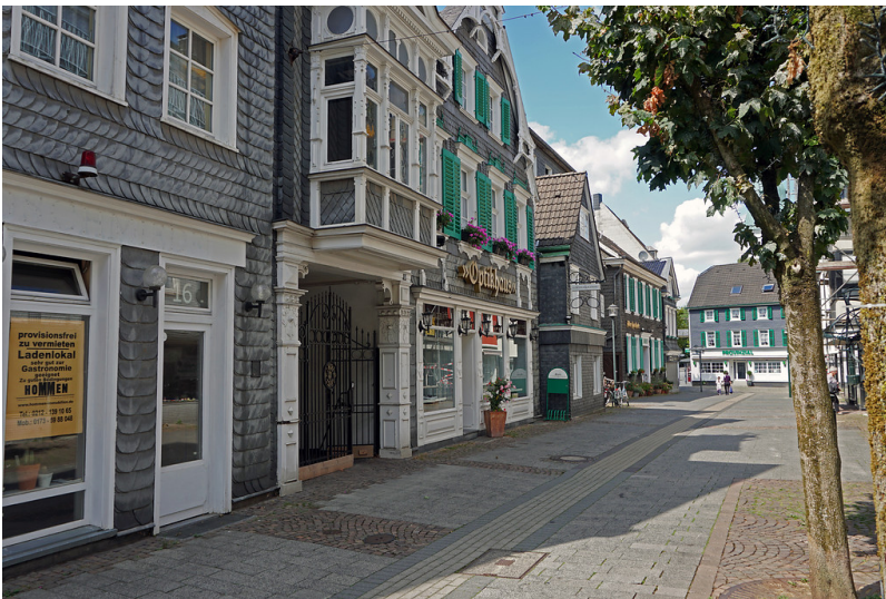
Solingen-Wald (2019)