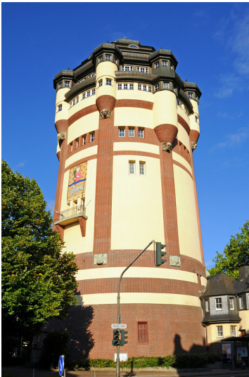
Wasserturm Mönchengladbach Fotograf/Urheber: Flinspach, Karlheinz