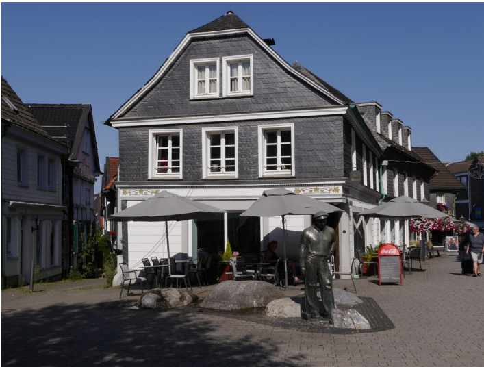
Wohn- und Geschäftshaus am Heumarkt im Ortskern von Wülfrath (2024)