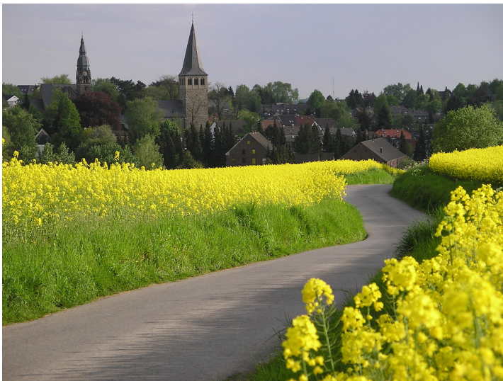
St. Jakobus der Ältere und Christuskirche in Ratingen-Homberg