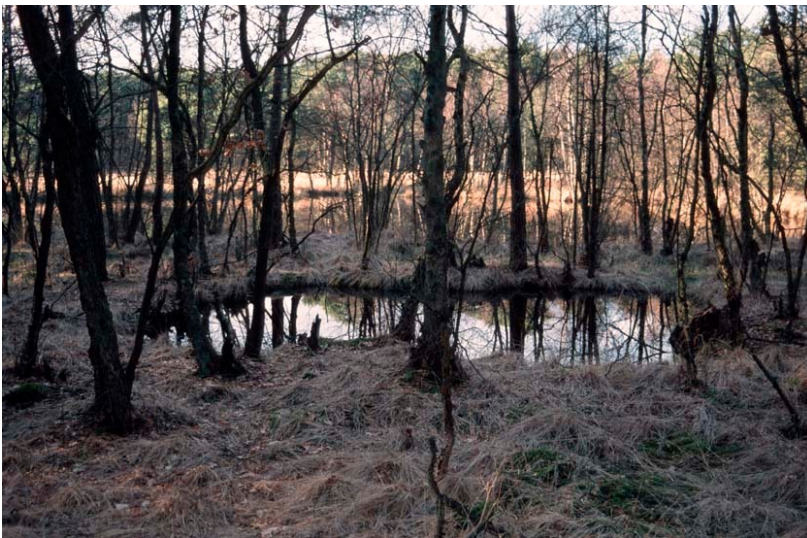
Flachsresten bei Brüggem